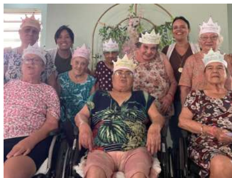
Comemoração do Dia das Mulheres 05/03/2026