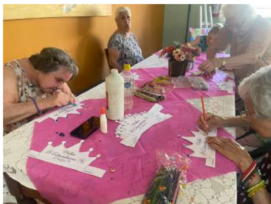
Atividade Artística 03/03/2026