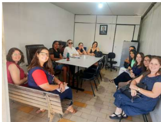
Reunião do CMAS 17/03/2026