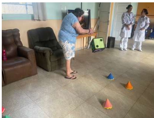
Atividade Lúdica 19/03/2026