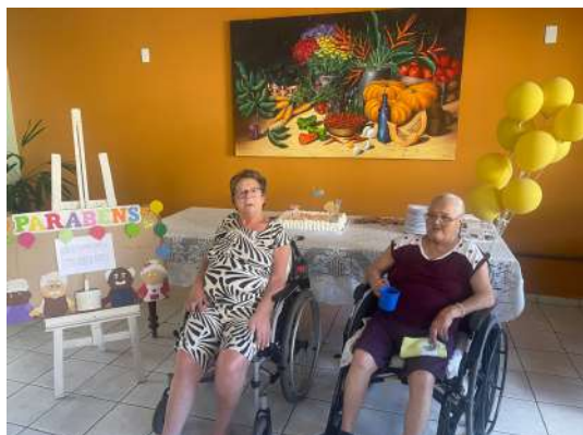
Aniversariantes do mês 26/03/2026