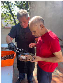
18 - Junho