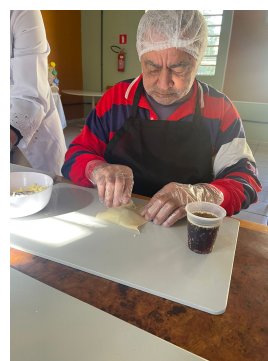
15 - Maio