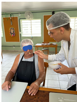
25 - Fevereiro