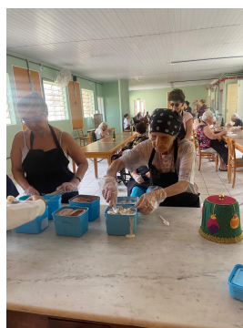
10 - Dezembro