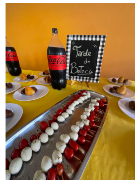
22 - Maio