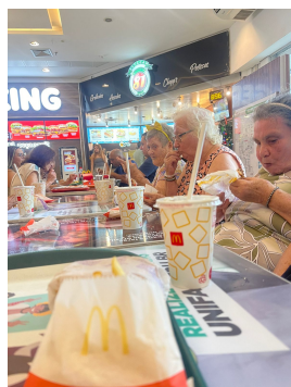
26 - Dezembro