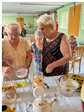
25 - Março