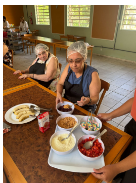
14 - Março