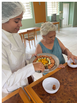
22 - Abril