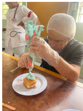
26 - Agosto