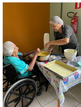
14 - Janeiro