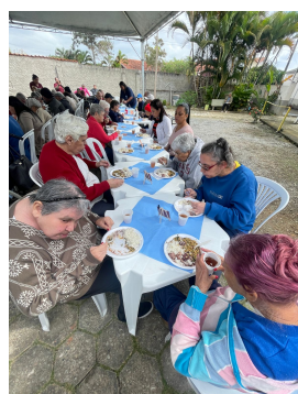
09 - Junho