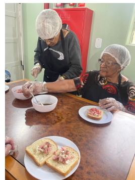
16 - Setembro