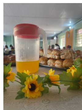
23 - Setembro