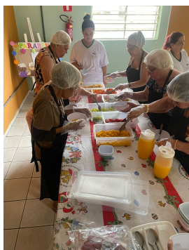
21 - Setembro

Todos os idosos envolvidos nas atividades vestiram toucas, luvas e aventais, assegurando a manutenção de rigorosos padrões de higiene conforme ilustram as imagens abaixo.