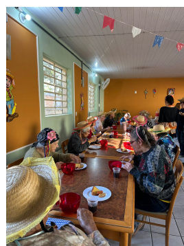
14 - Julho