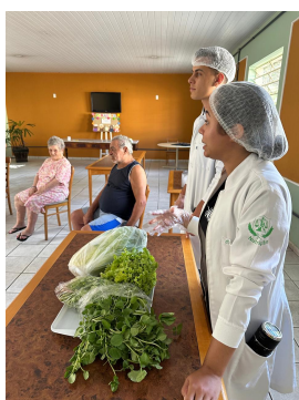
20 - Fevereiro