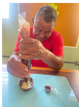
17 - Abril