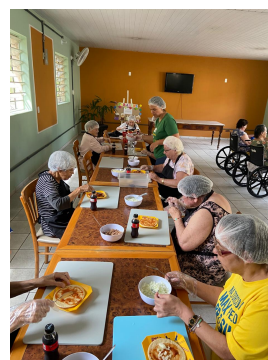
16 - Janeiro