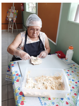
14 - Setembro

Além das oficinas, também foi realizada uma roda de conversa com a nutricionista, que abordou a importância de consumir alimentos nutritivos. Esse momento foi fundamental para incentivar a participação familiar, promover interações significativas e fortalecer os laços de convivência. A orientação da equipe técnica também foi essencial para garantir que os idosos se sentissem apoiados e motivados a adotar hábitos mais saudáveis.