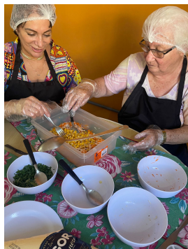
21 - Julho