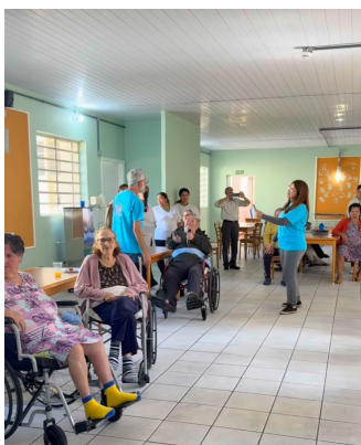
Meta 3.1 – Imagem 01 Atividade Cultural Dia 27/09/2025

Todas as atividades foram disponibilizadas para a participação de todos os idosos, apesar dos estímulos realizados, infelizmente ocorreram muitas recusas.