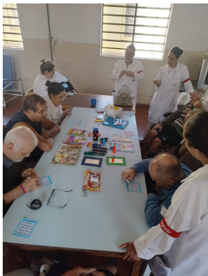
Meta 3.1 – Imagem 02 Atividade Lúdica Dia 19/09/2025