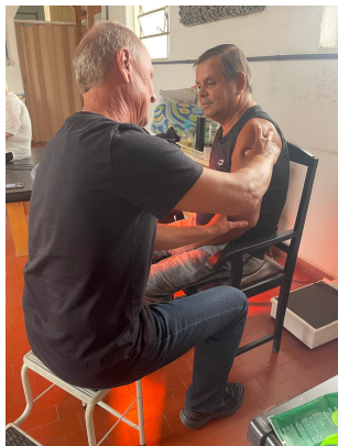
Meta 01: Imagem 02 Massagem Terapêutica 12/09/2025