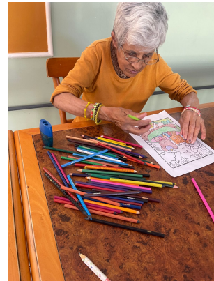
Meta 3.1 – Imagem 04 Atividade Artística Dia 16/09/2025

OBJETIVO ESPECÍFICO: Promover o acesso a programações culturais, de lazer, de esporte e ocupacionais internas e externas, relacionando-as a interesses, vivências, desejos e possibilidades do público, bem como a convivência mista entre os residentes de diversos graus de dependência.