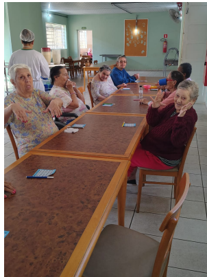
Meta 3.1 – Imagem 03 Atividade Lúdica Dia 09/09/2025