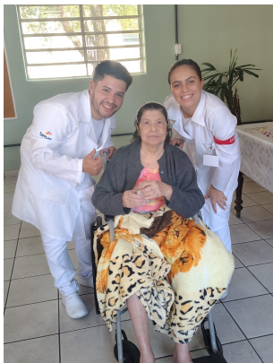
Meta 01: Imagem 01 Estagiários 10/09/2025

A OSC esteve comprometida no cumprimento desta meta, porém encontrou dificuldades no processo pré-acolhimento onde ocorreu atrasos. Dois idosos seguem agendados para acolhimento no mês de setembro.