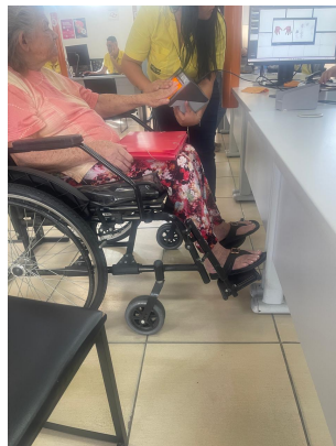
Meta 01: Imagem 03 Poupatempo 15/09/2025