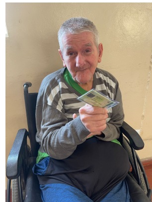
Meta 01: Imagem 04 Atualização de dados 16/09/2025

OBJETIVO ESPECÍFICO: Qualificar a oferta do serviço por meio da promoção da capacitação sistemática dos profissionais responsáveis pela oferta dos serviços.